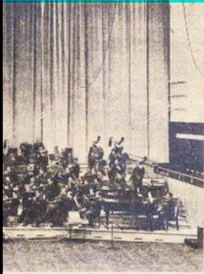
...tion de M. Franz André, se produira ...lle des Fêtes de l'Exposition, ...mmage à Guillaume Lekeu.