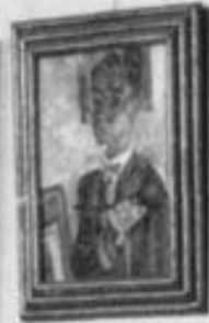
Portrait von [Name]