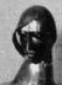
Abstrakte Skulptur von [Name]