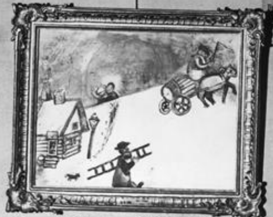
Düsseldorf 1924 1500.-M