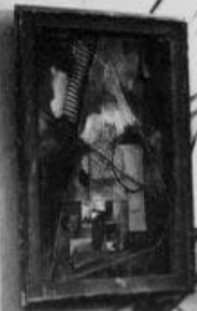
Schwitters, Marmor Denken 1919-1920