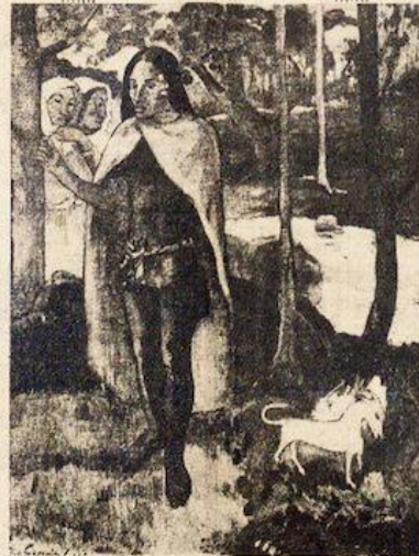
Paul GAUGUIN : Tahiti .