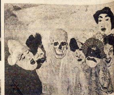
James ENSOR : Les Masques et la Mort .