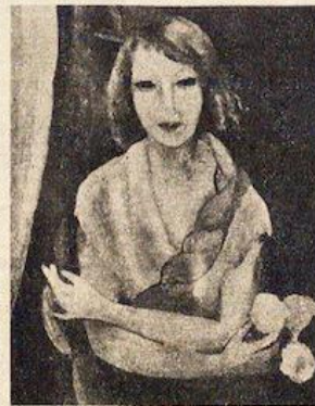
Marie LAURENCIN : Portrait de Fillette .