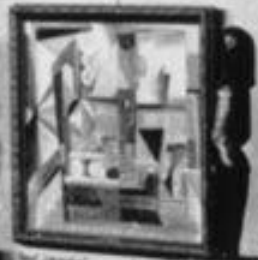
Abstrakte Komposition von [Name]