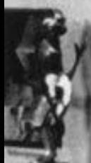
Abstrakte Skulptur von [Name]