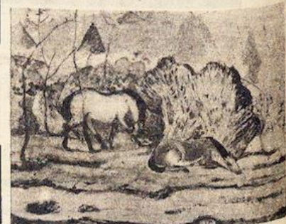
MARC : Les Cheveux bleus .