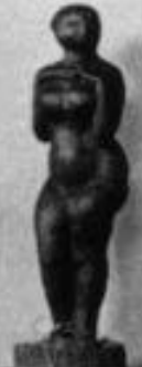
Abstrakte Skulptur von [Name]