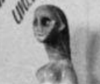
Abstrakte Skulptur von [Name]