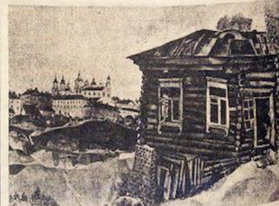
CHAGALL : La Maison bleue .