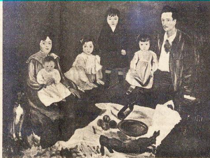
Voici les neuf tableaux acquis à la vente de Lucerne pour la ville de Liège et dont la présentation eut lieu mercredi dernier à l'Académie des Beaux-Arts de notre ville. Ci-dessus, La Famille Soler , de PICASSO.