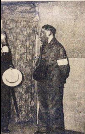
A l'exposition de protection antiaérienne, qui se tient au Hall des Expositions tempo- raires, la chambre à gaz lacrymogènes mise à la disposition du public pour l'essai des masques.