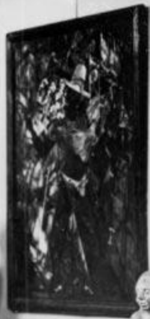
Walter Hasenclever Hut Mal 1919