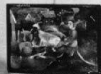
Abstrakte Komposition von [Name]