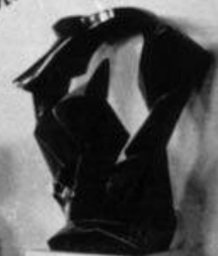
Abstrakte Skulptur von [Name]