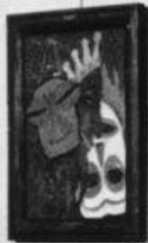
Abstrakte Komposition von [Name]