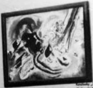
Marcel Duchamp Nahmenspiel: Berlin 1919